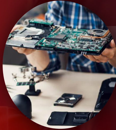
Ensamblaje de Computadoras